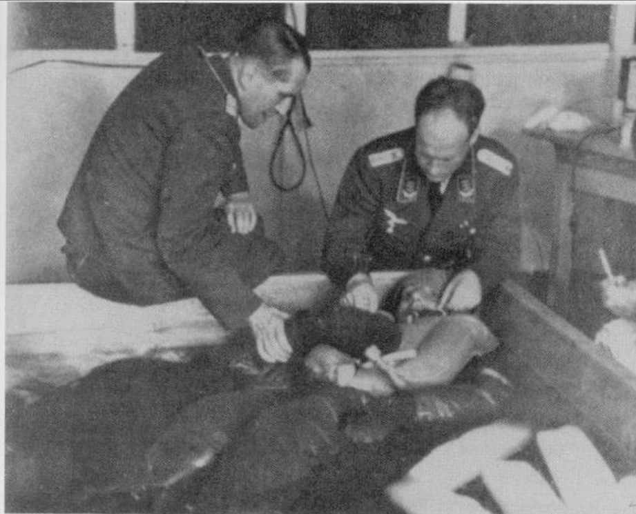
A freezing experiment at Dachau concentration camp. Dr. E. Holzlöhner, left, professor of physiology at the Medical School of the University of Kiel, and Dr. Sigmund Rascher, right, observe a victim immersed in ice water. This particular man was a political prisoner.